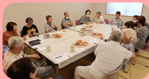
うみべの家で行う地域の方の集い 「茶」まり場

※次号のうみべの家だよりでは、茨城労働基準監督署が訪問されたことについてお伝えしたいと思っております。