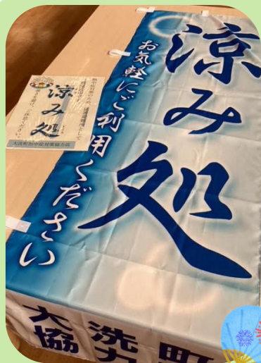
猛暑避難所「涼み処」(9月)